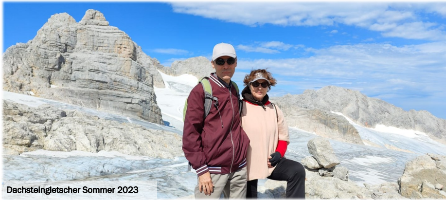
Dachsteingletscher Sommer 2023